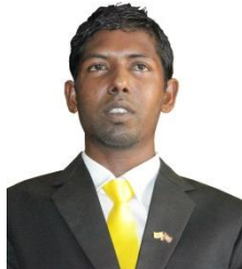
මැතිවරණ ප්‍රතිචාර (මැතිවරණ ප්‍රතිචාර)