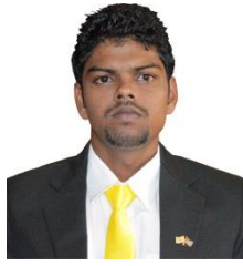
මැතිවරණ ප්‍රතිචාර (මැතිවරණ ප්‍රතිචාර)