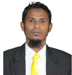
මැතිවරණ ප්‍රතිචාර (මැතිවරණ ප්‍රතිචාර)