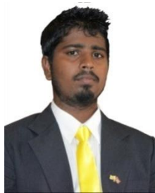
මැතිවරණ ප්‍රතිචාර (මැතිවරණ ප්‍රතිචාර)