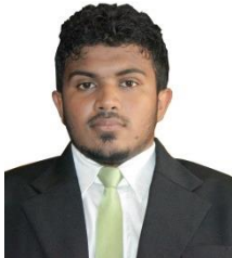
මැතිවරණ ප්‍රතිචාර (මැතිවරණ ප්‍රතිචාර)